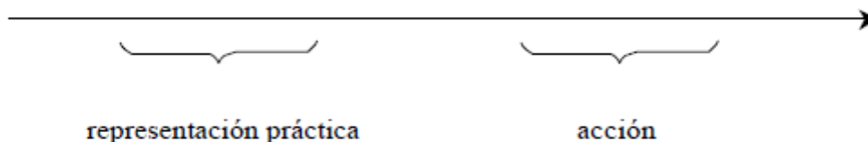
Figura 2: Estructura temporal de una derivación práctica

Entonces, las derivaciones prácticas tienen la siguiente estructura temporal: